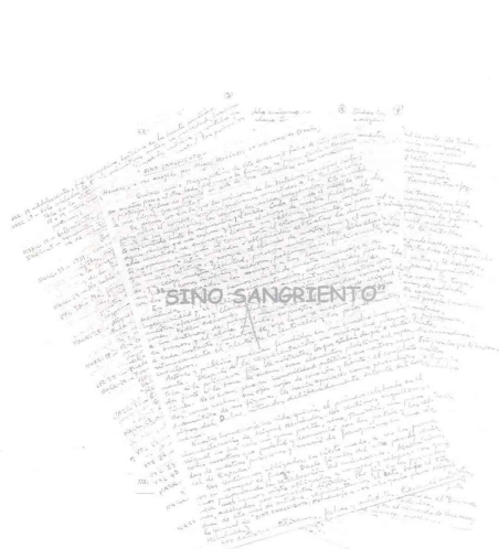
Manuscrito, en pequeña letra carcelaria, del Homenaje a Miguel Hernández sacado clandestinamente de la Prisión de Burgos y reproducido en el exterior